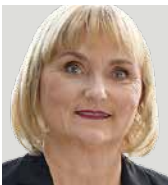
BÜNDNIS 90/ DIE GRÜNEN