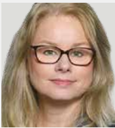
BÜNDNIS 90/ DIE GRÜNEN