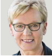
BÜNDNIS 90/ DIE GRÜNEN